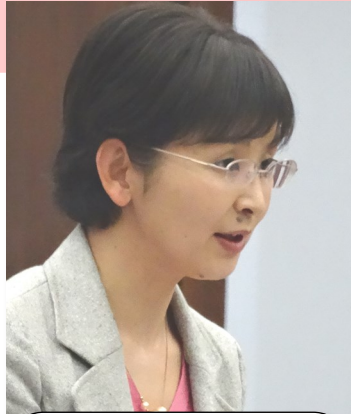
3月19日の予算特別委員会