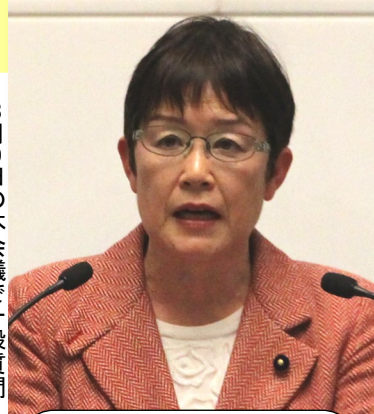
3月9日の本会議で一般質問