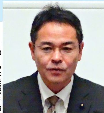
3月23日の本会議で討論