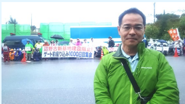
米軍キャンプシュワブ正門前で1000日目集会を実施。雨の中訴える人々と抗議行動に参加 2017年4月1日

島の人々の意思を無視し、「シユゴンの海」く辺野古に新基地をつくらうと、政府は法律を無視し、強引な工事を進めています。平和を守る尊さや、明るくきげんとした姿勢から多くのことを学びました。